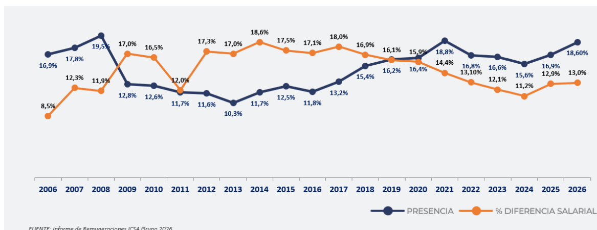
Evolución diferencias retributivas y nivel de presencia directiva

En este periodo, la representación femenina en posiciones directivas ha crecido de forma sostenida, pasando de situarse en el 16,9% en 2006 al 18,6% actual, mientras que la presencia masculina continúa siendo mayoritaria en los niveles de mayor responsabilidad. Desde 2013, el momento de menor presencia con el 10,3%, el incremento acumulado ha sido de ocho puntos porcentuales, evidenciando que el crecimiento de la representación femenina se ha acelerado en la última década.